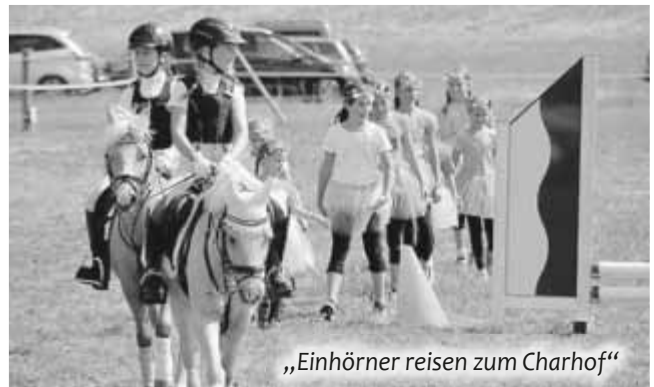
„Einhörner reisen zum Charhof“