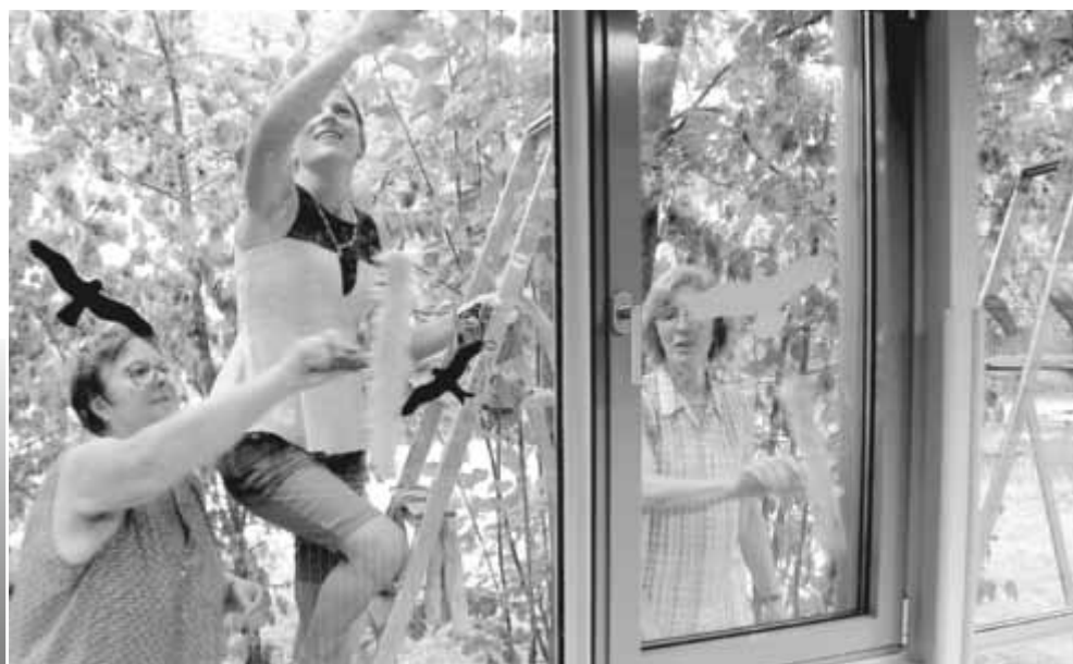
Fleißige Hände beim Reinigen der Glasflächen am Auracher Schulhaus

mit eigenem Personal zu gewährleisten; das mag oberflächlich betrachtet etwas teurer sein; langfristig gesehen kommt diese Vorgehensweise den Gebäulichkeiten und der Schulfamilie zugute und sorgt nicht zuletzt für faire Arbeitsbedingungen. Immer wieder äußern sich Gäste in unserem Schulhaus anerkennend über die Sauberkeit und den Top-Gebäudezustand – ein Verdienst der Mitarbeiterinnen und des Hausmeisters!