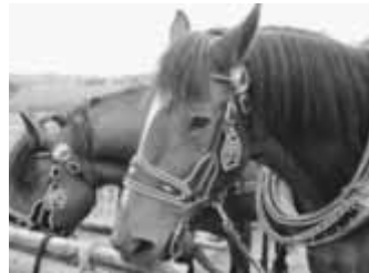
Tradition – früher in den Dörfern ein vertrautes Bild