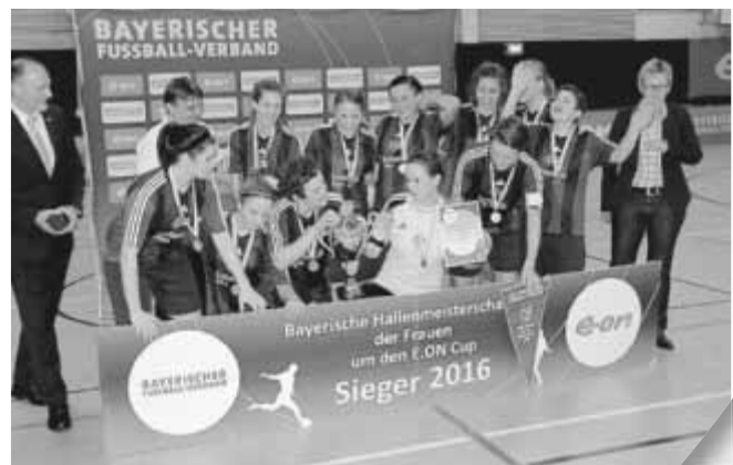
Siegerinnen sind die Frauen des FC Forstern aus dem Landkreis Erding.