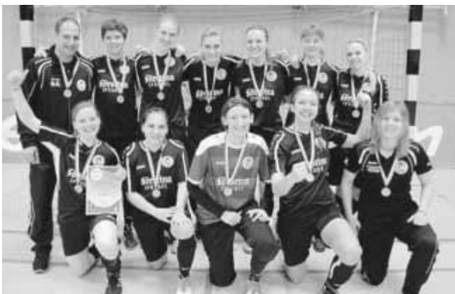
II. Frauen-Mannschaft des SV 67 Weinberg

Die Vizemeisterschaft sicherte sich die II. Frauen-Mannschaft des SV 67 Weinberg.